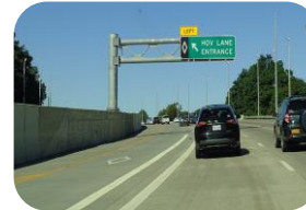
Traslados nacionales e internacionales