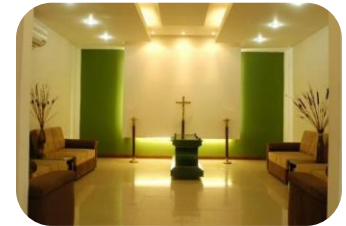
Sala de velación en funeraria