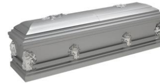
Ataúd Metálico estándar para velación