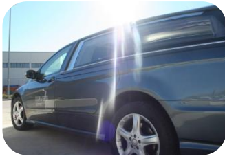
Traslado del hospital o domicilio a la funeraria