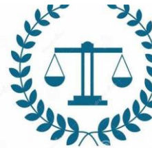
Asesoría Jurídica testamentaria