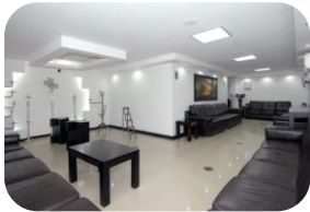
Ampliación de sala de velación