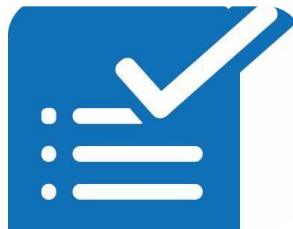
Gestión de trámites