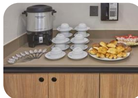
Servicio de cafetería