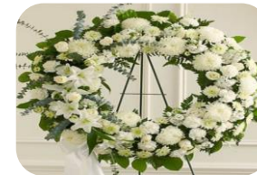
Arreglos florales con entrega directa en capilla