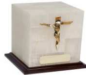
Cambios en Ataúd y urna