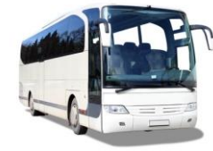
Transporte para acompañantes en caso de inhumación