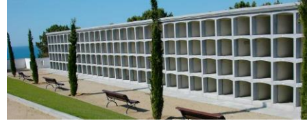
Fosa en panteones o nichos